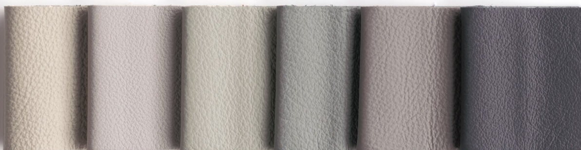
647 Grigio Perla