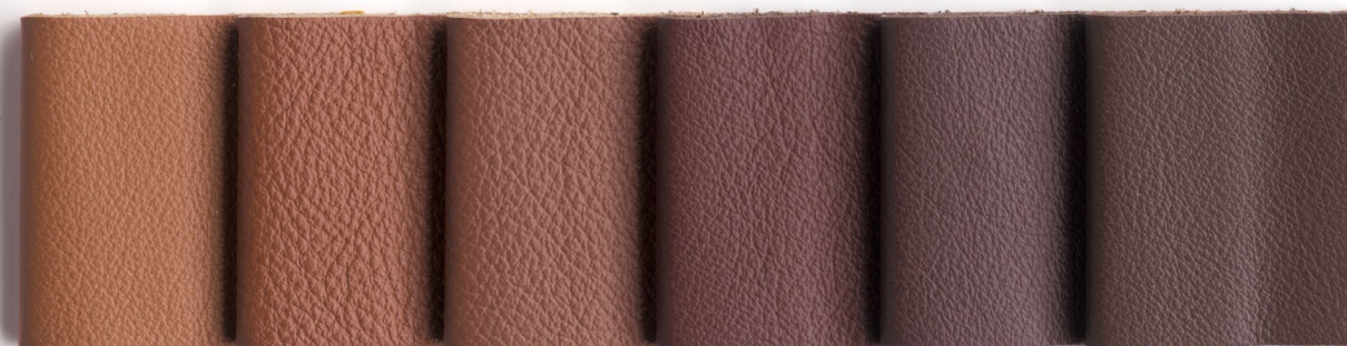
680 New Cognac