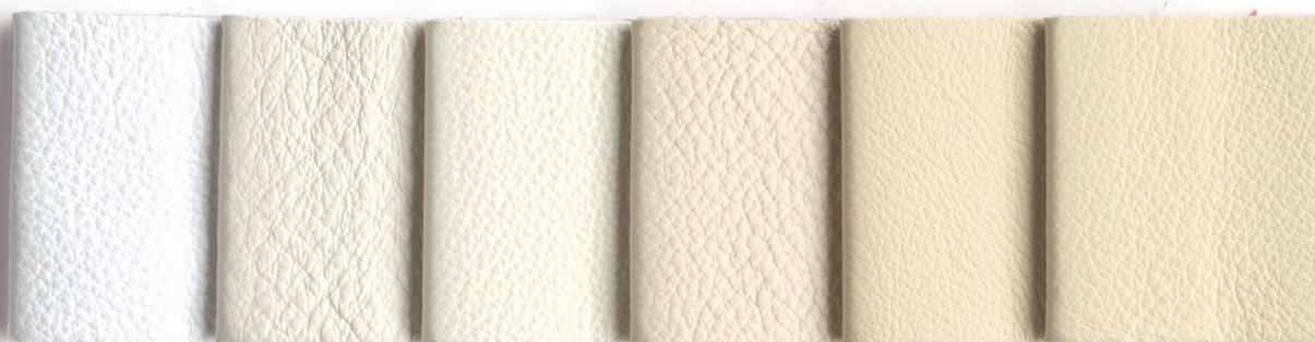
601 Bianco Ottico