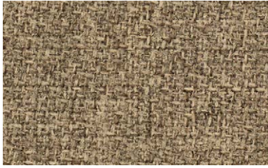
29 | Step Melange Screen 62543

mittelgrau / medium grey / gris moyen / middelgrijs