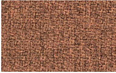
86 | Step Melange Screen 63539

dunkelbeige / dark beige / beige foncé / donkerbeige