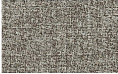
52 | Step Melange Screen 60545

mittelgrau / medium grey / gris moyen / middelgrijs