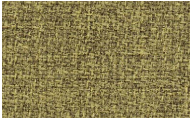
31 | Step Melange Screen 68501

blaugrau / blue grey / bleu gris / blauwgrijs