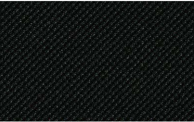
62 schwarz / black / noir / zwart

Atlantic, Gabriel 100 % polyester Uitsluitend te gebruiken voor de bespanning van rugleuningen Breedte 150 cm, gewicht per strekkende meter ca. 530 g Slijtvastheid 110.000 toeren Martindale Brandgedrag getest volgens DIN EN 1021, deel 1 en 2 voldoet aan het Europees ecolabel Vrij van schadelijke stoffen conform Eco-Tex standaard 100 100% vrij van zware metalen Voor de combinatie met scheidingswanden raden wij stofgroep 82 aan.