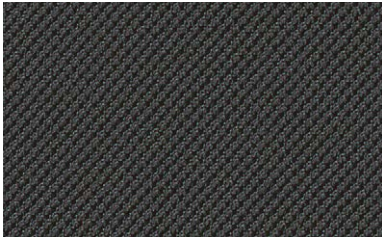
91 anthrazit / anthracite / anthracite / antraciet