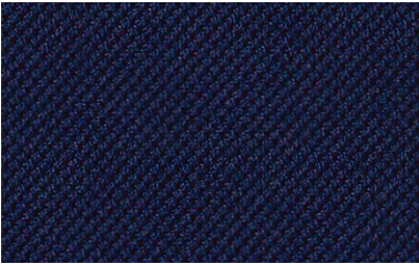
42 dunkelblau / dark blue / bleu foncé / donkerblauw