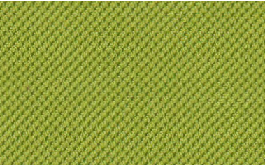
34 apfelgrün / apple green / vert pomme / applegroen