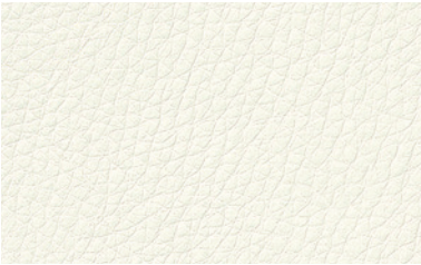
64 weiß / white / blanc / wit