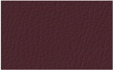
61 dunkelrot / dark red / ouge foncé / donkerrood