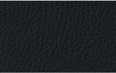
62 schwarz / black / noir / zwart

Dolce, Spradling 100 % polyurethaan, dragermaterialaal 100 % rayon Breedte 137 cm, gewicht per strekkende meter ca. 370 g/qm kunstleer pvc- en ftalaatvrij Slijtvastheid 300.000 toeren Martindale Brandgedrag getest volgens DIN EN 1021, deel 1 en 2 Silverguard® (milieuvriendelijke bacteriële bescherming)